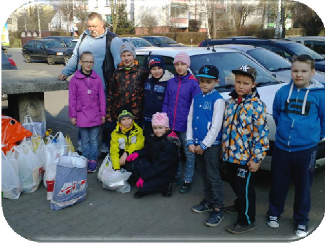
Zbiórka żywności PCK

W ramach ogólnopolskiej akcji „Wielkanoc z PCK” Szkolne Koło PCK zorganizowało zbiórkę żywności. Jak co roku, zbieraliśmy produkty dla najbardziej potrzebujących.