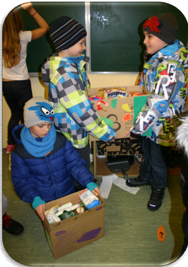
Chłopcy z klasy 3c dzielnie pomagali w zbiórce żywności

Każdego roku przed świętami Polski Czerwony Krzyż organizuje zbiórkę żywności dla najbardziej potrzebujących „Czerwonokrzyńska Gwiazdka”. W tym roku udało nam się zebrać bardzo dużo jedzenia. Wszyscy uczniowie, którzy wsparli naszą akcję otrzymali serduszka z napisem „Pomagam”. Bardzo dziękujemy wszystkim za okazaną pomoc!