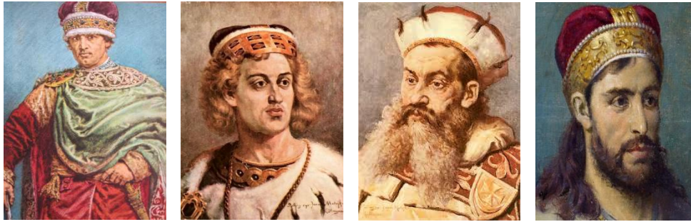
Władysław Wygnaniec, Bolesław Kędzierzawy, Mieszko III Stary, Kazimierz Sprawiedliwy