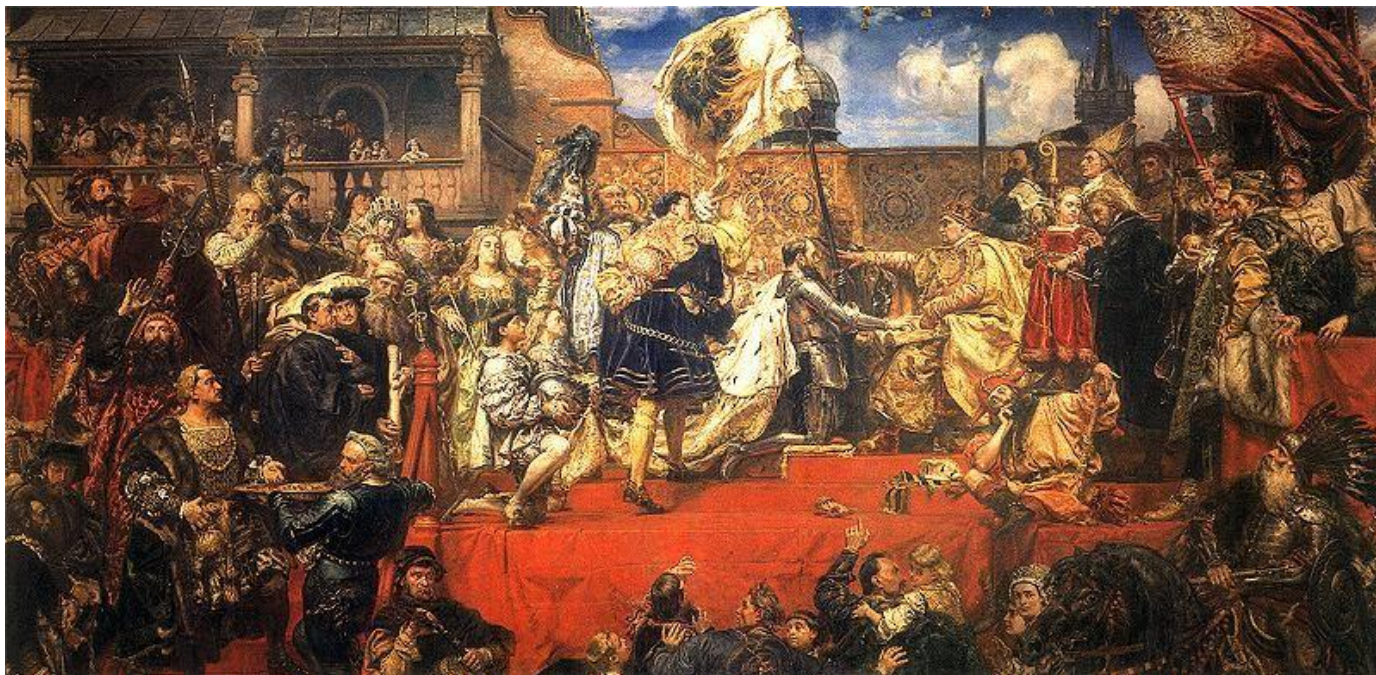
Jan Matejko, Hołd Pruski