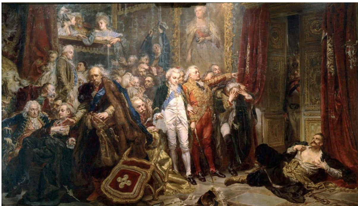
Jan Matejko, Rejtan – Upadek Polski