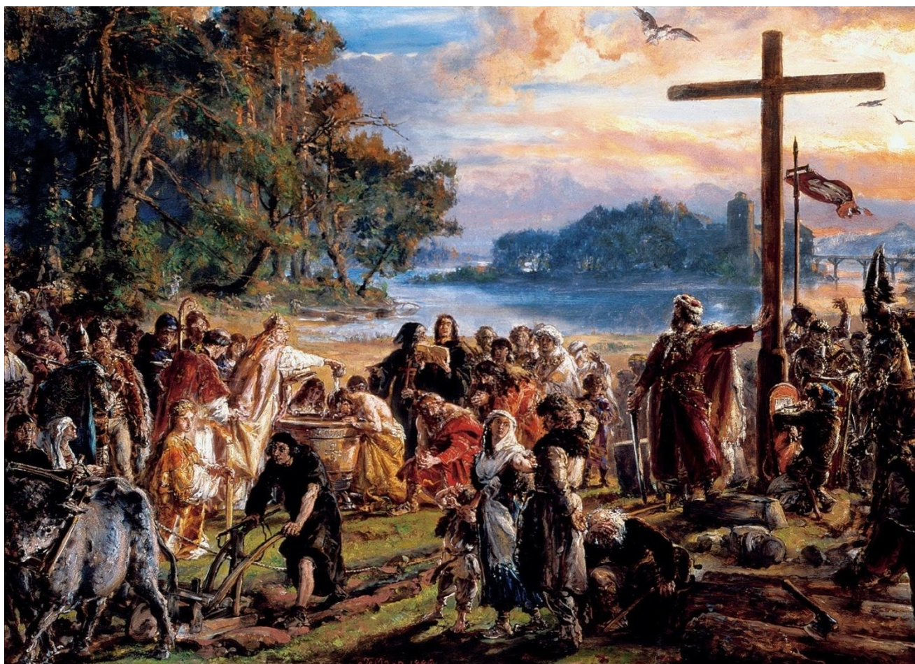
Jan Matejko, Chrzest Polski

968 r. w państwie Mieszka pojawił się pierwszy biskup - Jordan (jego siedzibą został Poznań), który miał kierować nowopowstającym Kościołem.