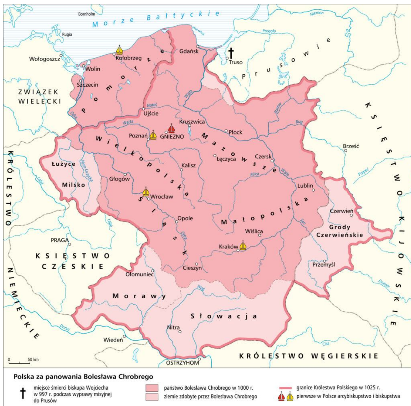
Mapa 2.: Polska za czasów Bolesława Chrobrego

Walki z Henrykiem II trwały jeszcze przez wiele lat. Bolesław odparł trzy najazdy władcy niemieckiego na Polskę. Zakończenie sporu nastąpiło dopiero w 1018 r. zawarciem pokoju w Budziszynie. Polska utrzymała Miłsko i Łużyce (bez żadnych zobowiązań wobec cesarza) oraz Morawy.