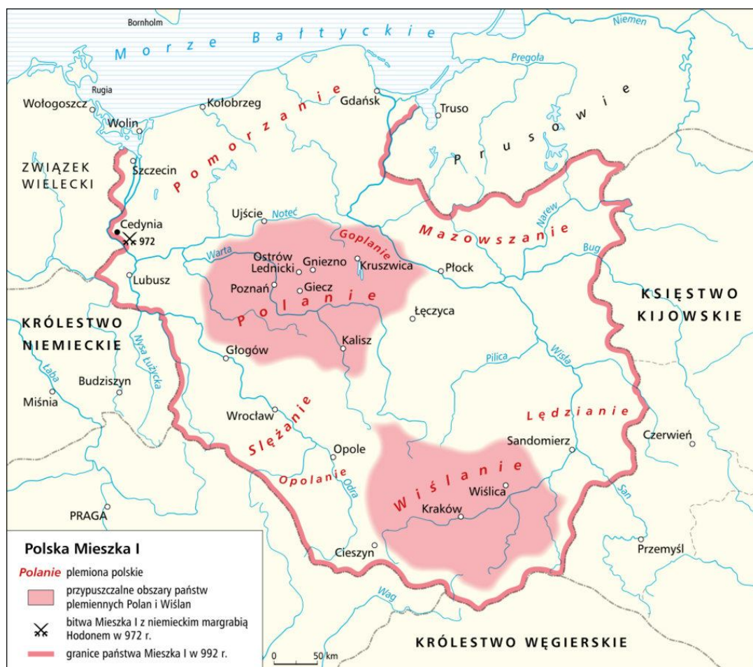
Mapa 1.: Polska Mieszka I

"A co się tyczy kraju Mieszka, to jest on najrozleglejszy z ich krajów [Słowian]. Obfituje on w żywność, mięso, miód i rolę orną. (...) Z Mieszkim sąsiadują: na wschodzie Rus, a na północy Burus (Prusy). Siedziby Burus leżą nad Oceanem (tzn. Morzem Bałtyckim). Obszerne państwo w krainach Słowian, nad morzem, wśród gęstych lasów, przez które trudno się wojskom przedzierać. Imię króla jest Mieszko".