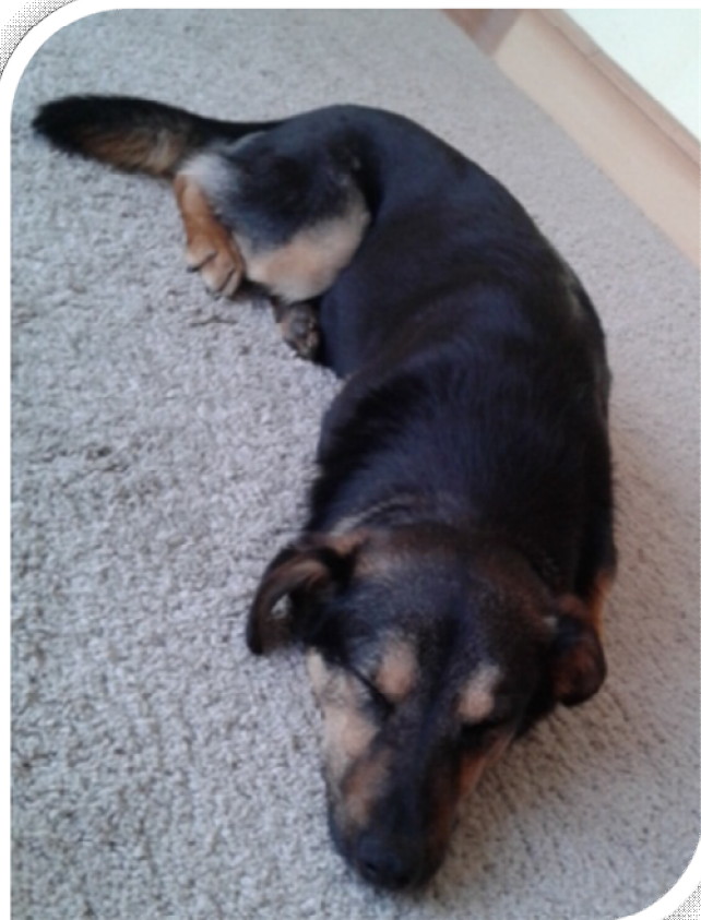
Na zdjęciu: Aslan