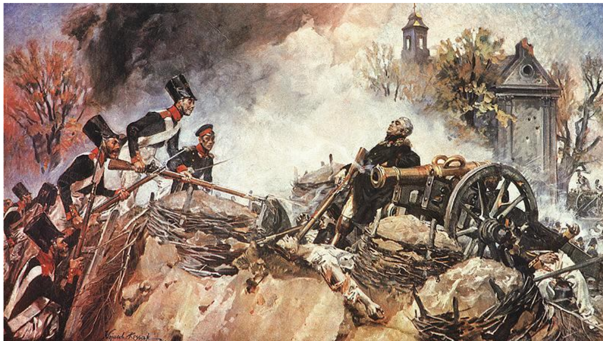
Gen. Sowiński na szanłcach Woli, Wojciech Kossak

zmobilizował mieszkańców stolicy do obrony, ale jeszcze odesłał część wojska na Polesie. Rosjanie uderzyli na Warszawę od zachodu (zaskoczyli Polaków, którzy przygotowywali obronę na południu). Jeszcze tego samego dnia padła na Woli reduta broniona przez Juliusza Ordona, śmierć poniósł generał Józef Sowiński. 8 września stolica poddała się.