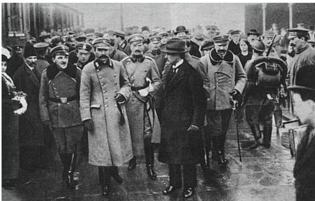
Powitanie Józefa Piłsudskiego na w Warszawie

Na początku 1917 r. kwestię Polską poruszył w swoim przemówieniu prezydent USA Thomas Woodrow Wilson. Komitet Narodowy Polski działający w Paryżu (Roman Dmowski) przekonywał państwa entanty do stworzenia państwa polskiego. Po rewolucjach w Rosji nowe władze uznały pełne prawo Polaków do własnego państwa. Komitet Narodowy Polski został uznany przez szereg państw za oficjalną reprezentację Polski. W styczniu 1918 r. prezydent USA ogłosił program pokojowy (14punktów Wilsona) – 13 punkt dotyczył odbudowy Polski.