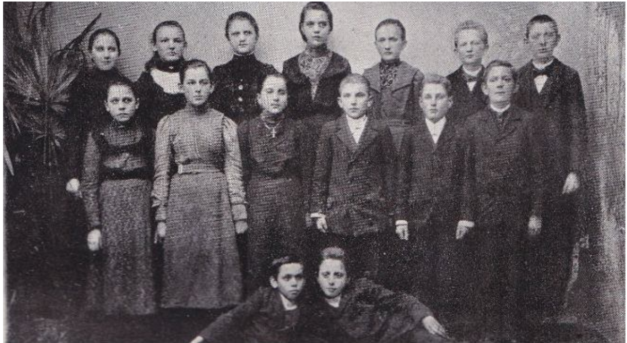
Uczestnicy strajku dzieci wrześnińskich

Szerokim echem wśród Polaków rozniósł się strajk dzieci we Wrześni. 4 marca 1901 r. dotarło do szkoły zarządzenie pruskich władz oświatowych o wprowadzeniu języka niemieckiego do nauki religii od nowego roku szkolnego. Gdy nadeszły katechizmy w języku niemieckim, dzieci odmówiły ich przyjęcia, albo w porozumieniu z rodzicami zwróciły je następnego dnia. Dzieci, korzystając z rad rodziców zastosowały bierny opór, odmawiając odpowiedzi w języku niemieckim na lekcjach religii, za co spadły na nie represje i kary cielesne.